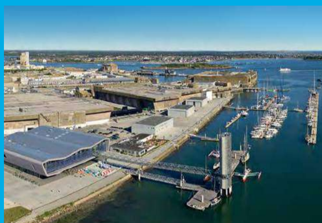
Découvrez l'ancienne base de sous-marins, port stratégique de la façade atlantique pendant la Seconde Guerre mondiale