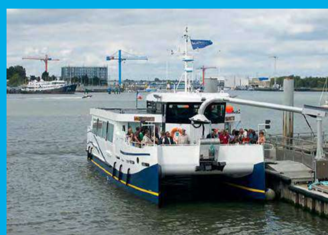
Embarquez à bord du bateau zéro émission "Ar Vag Tredan" qui fait la liaison entre Lorient et Locmiquélic

DÉPART de l'Embarcadère de Pen Mané à Locmiquélic. Suivez le pas-à-pas du grand tour de rade au recto. Suivre le pas à pas du repère 11 sur Locmiquélic, au repère 19 sur Port-Louis, et ensuite celui du "retour vers Lorient par bateau" (voir recto) jusqu'à Port-Louis-La Pointe 17. De là, pour revenir au point de départ à Locmiquélic-Pen Mané 11 plusieurs possibilités : Revenir par l'itinéraire "aller" (8,2km). En semaine 1 prendre le bus à l'arrêt "La Pointe" coté mur en pierre pour un retour au point de départ. 11 Attention, pas de bateau Port-Louis Locmiquélic en semaine. Le dimanche vous avez le choix entre : prendre le bateau à l'embarcadère "Port-Louis La Pointe", il vous ramènera au point de départ. prendre le bus à l'arrêt "La Pointe" coté port de plaisance qui vous amènera aussi au point de départ.