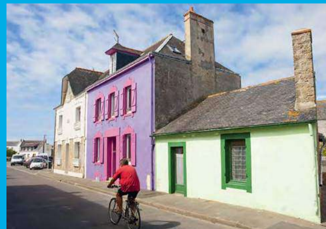
Parcourez un village typique de pêcheurs sur la presqu'île de Gâvres