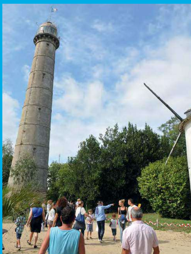
Arpentez le Péristyle où se nichent les derniers vestiges des origines de Lorient du temps, de la Compagnie des Indes Orientales

DÉPART de l'embarcadère Lorient-Quai des Indes. Suivez le pas-à-pas du grand tour de rade au verso. Du repère 10 sur Lorient prenez le bateau qui rejoint l'embarcadère de Pen Mané à Locmiquélic 11. Suivez le pas à pas jusqu'au repère 18 sur Port-Louis. En ressortant de la plage des pâtis 18 revenir droit devant vous pour rejoindre l'embarcadère de La Pointe 17. Le bateau se prends au bout de la jete, après la capitainerie. En semaine, embarquez vers "Lorient-Port de Pêche" 8. A la sortie du bateau 2 possibilités : Partir à droite et suivre l'itinéraire jusqu'au repère 10 pour rejoindre le point de départ de Lorient-Quai des Indes. Prendre le bus qui rejoint le point de départ et descendre à l'arrêt Quai des Indes. Le dimanche, embarquez vers Lorient-Quai des Indes via Locmiquélic. Arrivé à Lorient, faites le tour du Péristyle pas à pas 10.