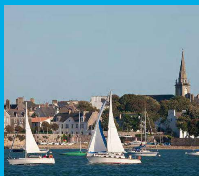
Contemplez le va-et-vient des bateaux et des oiseaux