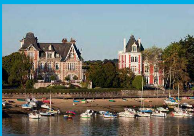
Admirez les villas près du port de plaisance du Kernével