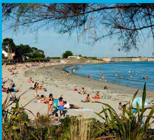
Farniente sur une plage de sable fin à Larmor-Plage

Du repère 1 sur Larmor-Plage, allez jusqu'au repère 10 embarcadère de Lorient-Quai des Indes. En continuant par la promenade au bord de l'eau, découvrez le Péristyle avec l'hôtel Gabriel, la Tour de la découverte et la Maison de l'Agglomération et revenez à l'embarcadère 10. De l'embarcadère pour rejoindre Larmor-Plage en bus, remontez droit devant vous le Quai des Indes sur toute sa longueur jusqu'à l'arrêt du Fauedic, où des lignes de bus rejoignent le départ à Larmor-Plage.