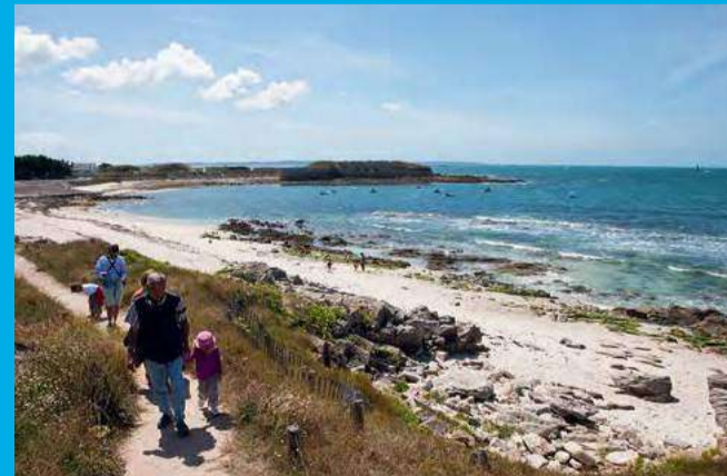
Profitez du panorama sur l'océan