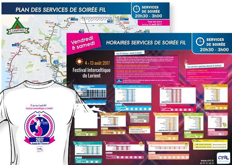
Plans et horaires de la Grande Parade et des lignes de soirées FIL

Il se présente sous la forme d'un billet Primo, valable du vendredi 4 au dimanche 13 août 2017 et donne droit à la libre circulation sur le réseau de bus et de bateaux, ainsi que sur les services de soirée FIL.