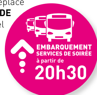
Adhésifs au sol, place de l'Hôtel de Ville

Le dispositif CTRL est déplacé sur le parking des HALLES DE MERVILLE , à 300 m de l'Hôtel de Ville. Une signalétique indique le cheminement pour y accéder facilement en partant de la place de l'Hôtel de Ville.