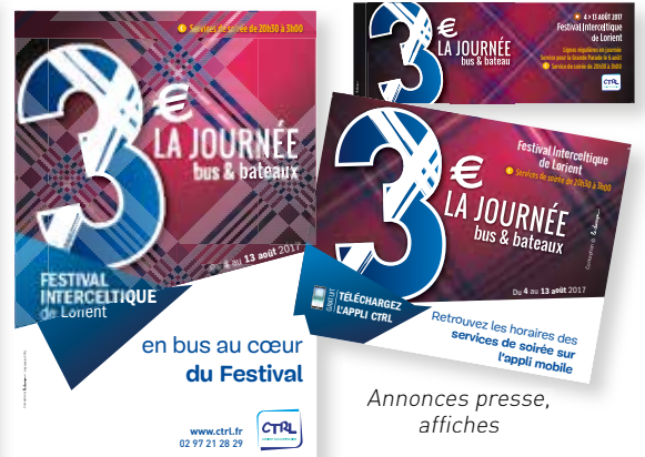
Annonces presse, affiches