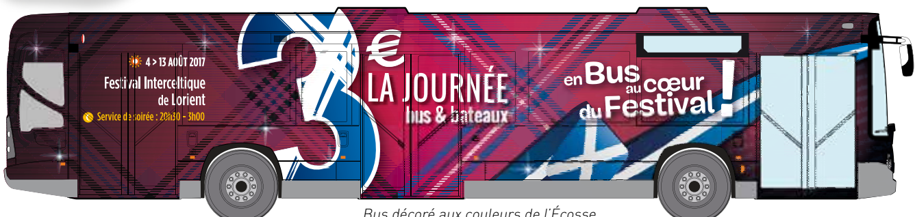
Bus décoré aux couleurs de l'Écosse, en circulation du 2 au 13 août 2017