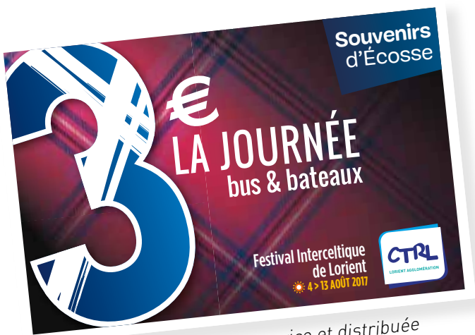
Carte postale en libre-service et distribuée le jour de la Grande Parade