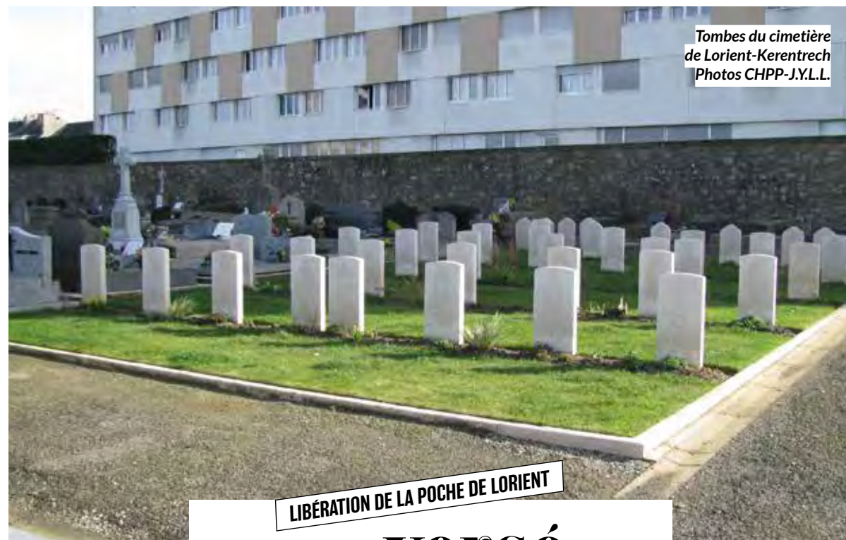
Tombes du cimetière de Lorient-Kerentrech