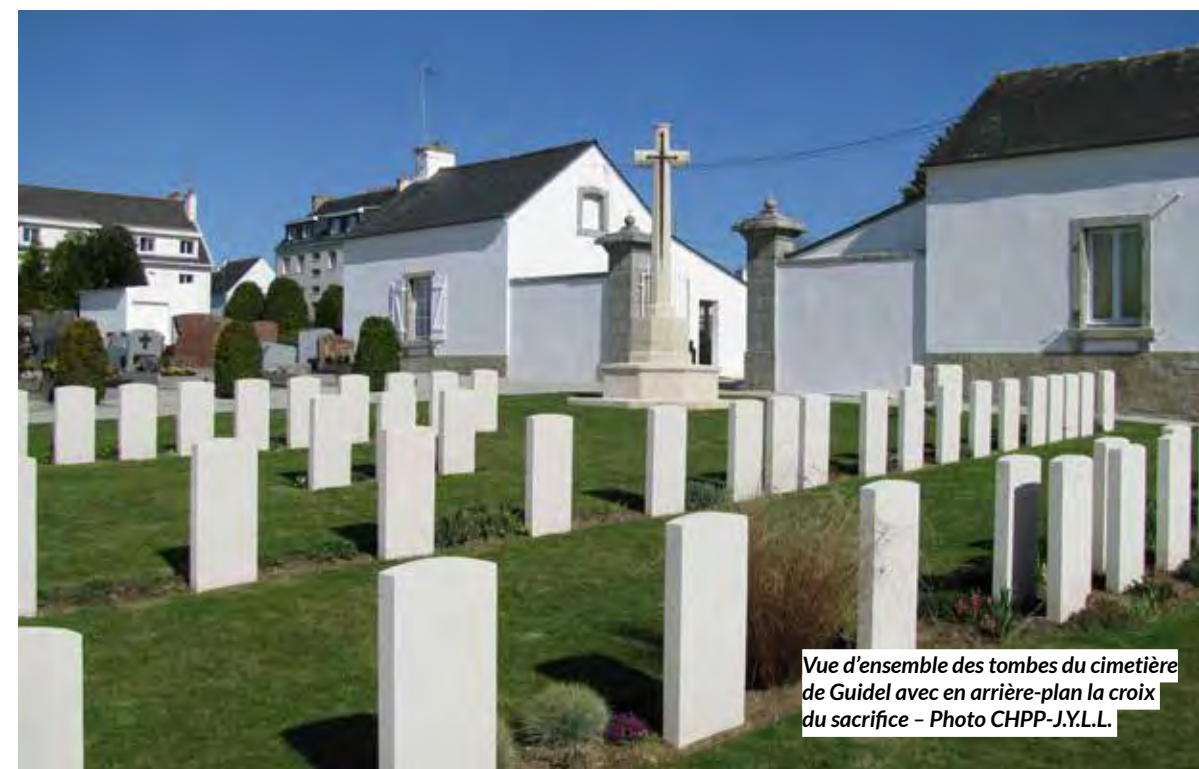
Vue d'ensemble des tombes du cimetière de Guidel avec en arrière-plan la croix du sacrifice