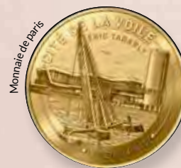
Monnaie de Paris

Lorient a beau être une ville reconstruite, en termes de patrimoine, il y a de quoi faire. Si vous avez des enfants qui ont des questions sur la Seconde Guerre mondiale, allez faire un tour à Lorient La Base ! Monter tout en haut du bunker K3, c'est une véritable plongée dans l'Histoire. On se croirait dans un escape game.