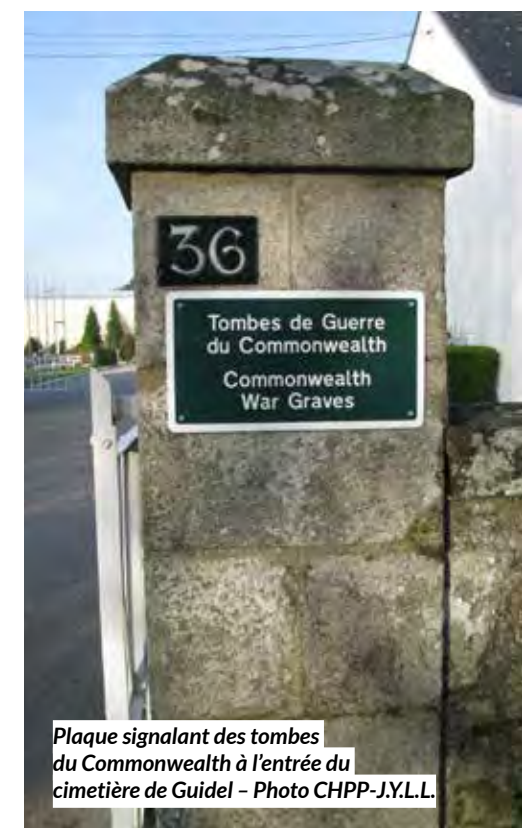
Plaque signalant des tombes du Commonwealth à l'entrée du cimetière de Guidel

Groupement des associations d'histoire locale du Pays de Lorient.