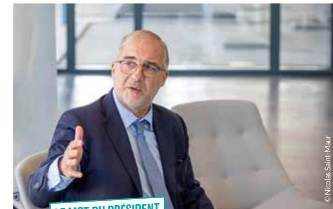
LE MOT DU PRÉSIDENT

« NOTRE PROGRESSION S'APPUIE NOTAMMENT SUR LA RÉVOLUTION DES MOBILITÉS »