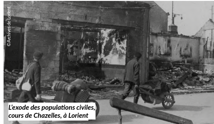
L'exode des populations civiles, cours de Chazelles, à Lorient

Lorient Agglomération et la Ville de Lorient ont mis leurs ressources en commun afin d'établir un programme très riche autour du 80 e anniversaire de la Libération de la Poche de Lorient. Le point d'orgue de ces commémorations sera la grande fête mémorielle populaire organisée le 10 mai prochain à Lorient La Base et à laquelle le grand public est invité. Mais ces commémorations seront aussi l'occasion de rendre hommage à celles et ceux qui se sont sacrifiés pour la Libération de la France et de rappeler l'extraordinaire capacité de résilience des habitants du Pays de Lorient qui ont su fonder une nouvelle communauté sur les ruines de villes presque entièrement détruites par les bombardements.